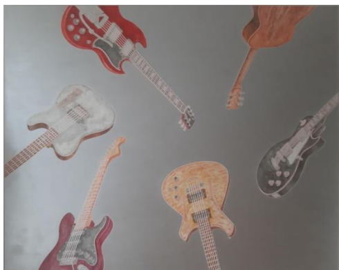
Abetz & Drescher Soul Explosion, 2019